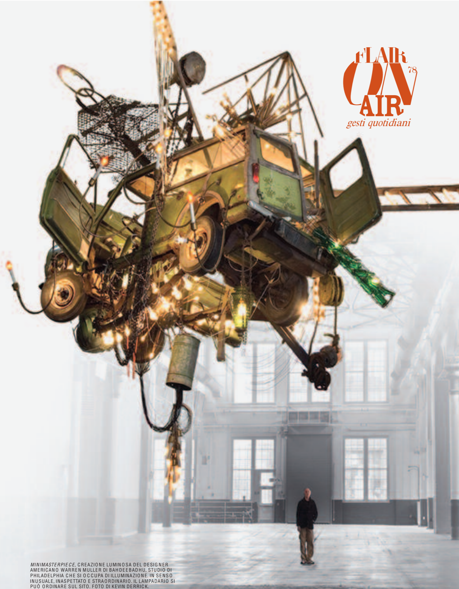
MINIMASTERPIECE, CREAZIONE LUMINOSA DEL DESIGNER AMERICANO WARREN MULLER DI BAHDEEBADHU, STUDIO DI PHILADELPHIA CHE SI OCCUPA DI ILLUMINAZIONE. IN SENSO INUSUALE, INASPETTATO E STRAORDINARIO. IL LAMPADARIO SI PUÒ ORDINARE SUL SITO.